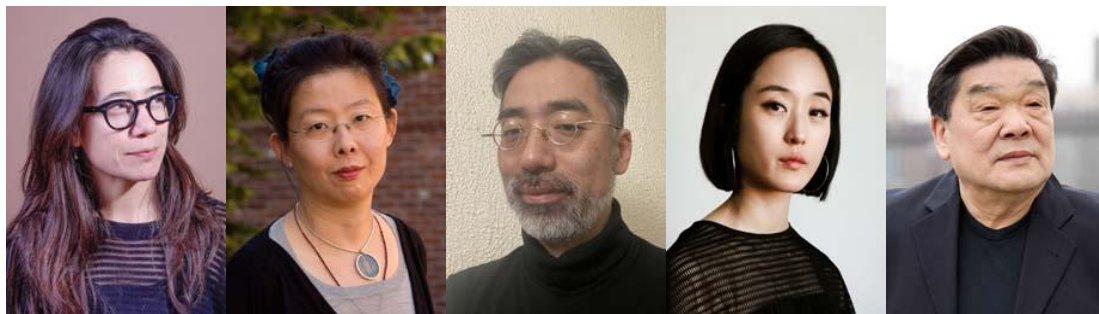
編舞余梅林、服裝設計蕭燕、燈光設計三枝步、投影設計金素妍、京劇專家關鴻鈞

黃若在不同音樂範疇創作深刻兼富有詩意的作品，廣受讚賞，包括他的偶戲歌劇《山海經》、清唱劇《天使島》以及與托尼獎得獎編劇黃哲倫多次合作的歌劇《一個美國士兵》、《裂痕》和《蝴蝶君》。黃哲倫的舞台作品包括百老匯話劇《蝴蝶君》、《黃面孔》及《中式英語》，音樂劇《軟實力》（作曲：吉尼恩·特索利）。他亦為以下歌劇擔綱編劇：《艾娜達馬》（奧斯瓦爾多·格利約夫）、《愛麗絲夢遊仙境》（陳銀淑）、三藩市歌劇院委約的《紅樓夢》（盛宗亮）及五部與菲利普·格拉斯合作的作品。《猴王悟空》是黃若和黃哲倫的最新創作，二人譜寫出糅合中國與西方傳統的歌劇，讓這位令人無可抗拒的、舉世崇拜的英雄人物得以重現舞台。